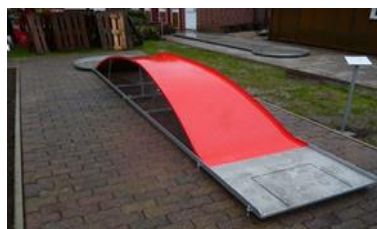
6 - MOST