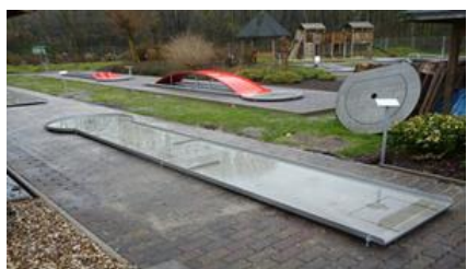
9 - PŘÍMÁ DRÁHA S PŘEKÁŽKAMI