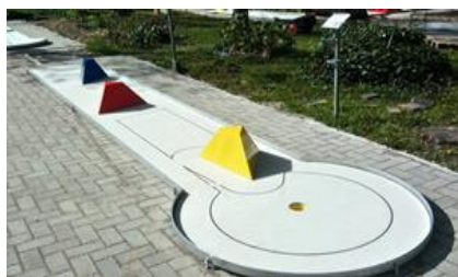
1 - PYRAMIDY TYP B