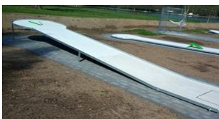
17 – DRÁHA S PŘEKÁŽKOU