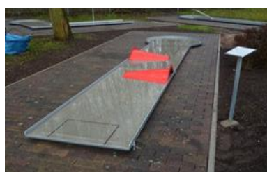
8 - ZDVOJENÝ KUŽEL