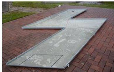
10 - BLESK