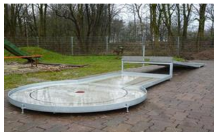
14 – MYŠÍ DÍRA KLÍN