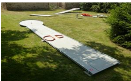
13 – ŠIKMÝ KRUH S PŘEKÁŽKOU