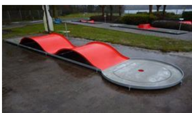
4 - VLNY