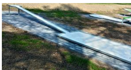
3 - PLOŠINA