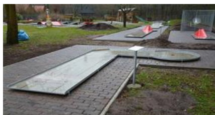
5 - ÚHEL