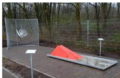
2 - KOŠ TYP A