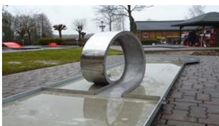
15 – LOOPING