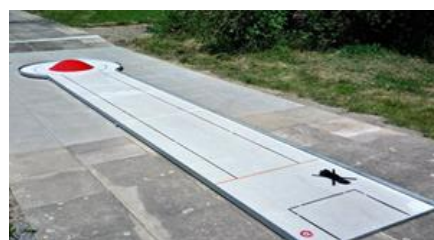
18 – CÍLOVÝ KOPEC – VRCHOL V KRUHU