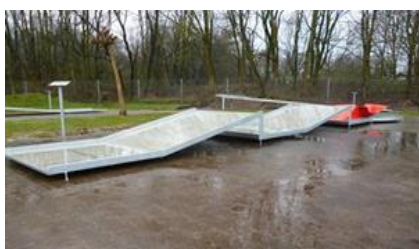
16 – KLÍNY