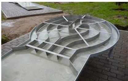
11 – LABYRINTH