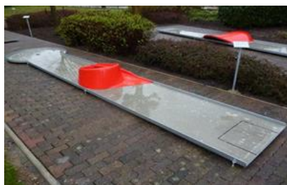
12 – SMYČKA