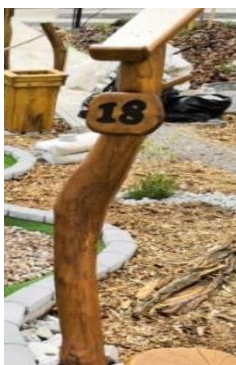
Stojany pro hráče z akátového dřeva